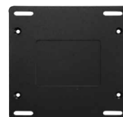
1 x пластина для крепежа David30