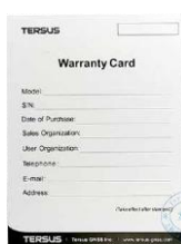
1 x Гар.талон