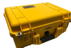
1 x Кейс

[1] Длина кабеля TNC-J к TNC-J по умолчанию составляет 25 м и может быть изменена в соответствии с требованиями заказчика.