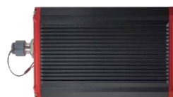
1 x Приемник David30