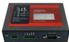
1 x Ntrip модем TR600