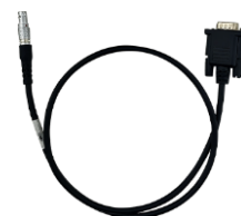
1 x Кабель COMM1-7pin to DB9 папа