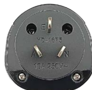
1x вилка GN901A / GN901G / GN901E / GN901N