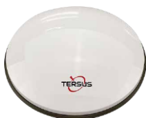
1 x AX4E02 GNSS антенна