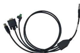
1 x COMM2-7pin - TR600-DC-2pin & DB9 мама и USB кабель