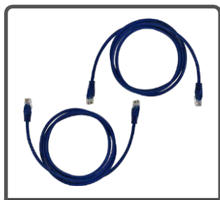
2 x кабель Ethernet 1.5m