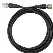
1 x TNC-J-TNC-J кабель [1]