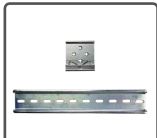
1 x крепления для TR600