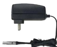
1 x Адаптер питания DC-5pin AC 1.2м