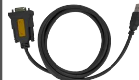
1 x кабель DB9 мама - USB Type A папа